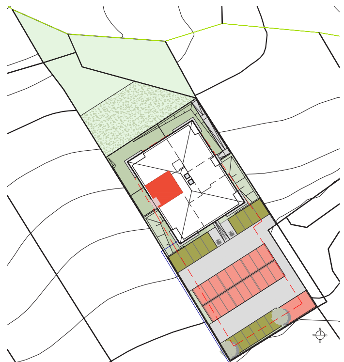
LAGEPLAN M 1:1000